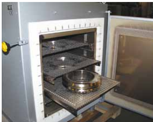
Four à convection forcée avec plateaux de chargement sur plusieurs niveaux. Les plateaux sont placés chacun sur des rails télescopiques et peuvent être sortis un à un.