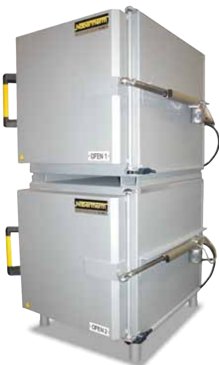
Système de four à chambre double composé de deux fours à convection forcée N 250/65 HA. L'ouverture est latérale avec des vérins pneumatiques pour faciliter le refroidissement ou le chargement.

En complétant le four avec des accessoires de chargement, il est possible, dans de nombreux cas, d'accélérer ou de simplifier le process de traitement thermique, voire d'augmenter la productivité. Les solutions présentées sur cette page ne sont que des exemples du potentiel de produits que nous pouvons vous livrer. Nous répondrons volontiers à toute demande de votre part, et travaillerons également avec plaisir en collaboration avec vos techniciens pour trouver une solution spécifique à vos problèmes.