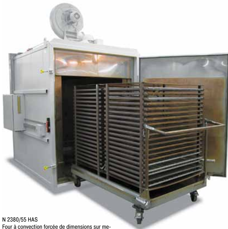
N 2380/55 HAS Four à convection forcée de dimensions sur mesures avec chariot de chargement pour le revenu de tôles plates