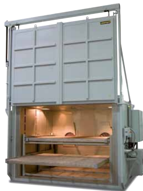
N 12012/26 HAS1 secondo AMS 2750 D

In alternativa alla strumentazione mediante regolazione PLC e Nabertherm Control-Center (NCC) può essere offerta una strumentazione con regolatori e termografi. Il termografo dispone di una funzione di protocollo che può essere configurata manualmente. I dati possono essere trasferiti su un pennino USB e analizzati, formattati e stampati su un PC a parte. Altro al termografo integrato nella strumentazione standard è necessario un dispositivo a parte per le misurazioni TUS (vedi pagina 68).