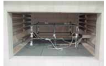
淬火炉内的测量结构