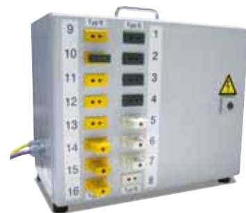
带有用于 16 个热电偶的输入端以及用于连接纳博热 Control-Center 的现场总线的 T U S 模块

T U S 模块包含一个自带的 P L C 系统，用于采用检验热电偶的测量结果输出评估包括一览性和简单的报告功能通过炉子的纳博热 Control-Center 完成。