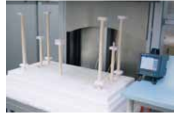
高温炉内的测量结构

根据对热处理的质量要求, 由客户方指定仪器仪表类型以及温度均匀性级别。仪器仪表类型对所使用调节装置、记录媒体和热电偶之间的必要关系作出了描述。窑炉的温度均匀性和所使用的仪器仪表的品质是根据所要求的窑炉级别来定的。对窑炉级别的要求越高, 则对仪器仪表的精度要求也越高。